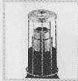
編號:074005 出風口保護罩