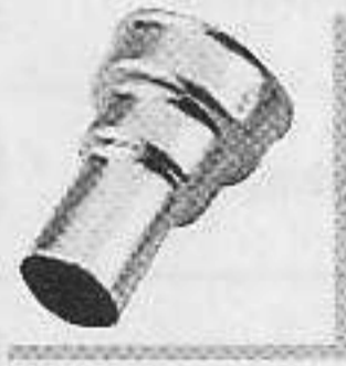
型號: 070816 名稱: 圓咀20毫米 功能: 集中較大風量