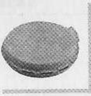
型號: 072117 名稱: 膠管焊咀75毫米 功能: 塑料管子焊接 須與070717接駁使用