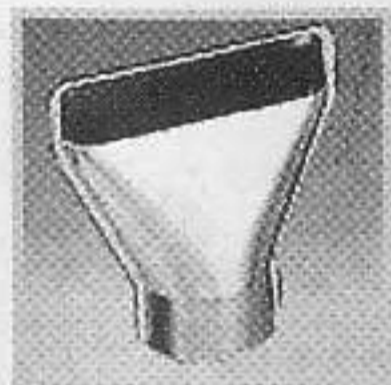
編號:070410 窗咀(75毫米) 保護及避免玻璃過熱.