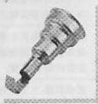
型號: 079994 名稱: 焊錫咀9毫米 功能: 焊錫及熱收縮 須與070618接駁使用