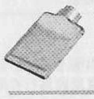
型號: 074715 名稱: 扁焊咀40毫米 功能: 膠板焊接 須與070717接駁使用