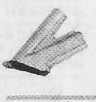
型號: 070915 名稱: 膠焊咀9毫米 功能: 6毫米以下膠焊綫 須與070618接駁使用