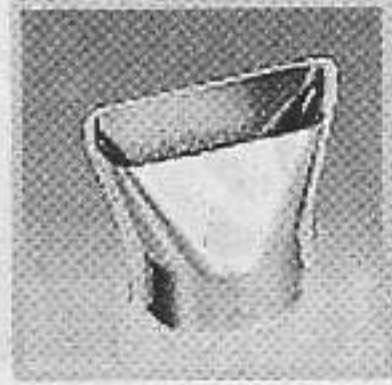
編號:070311 窗咀(50毫米) 在狹小的位置加熱過程中, 避免出現過熱.