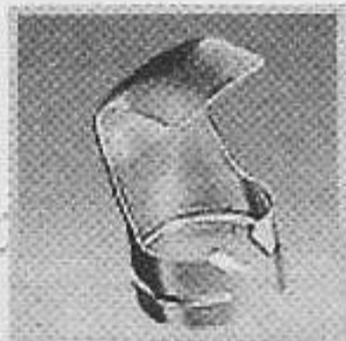
編號:070519 反射咀 焊錫及熱收縮.