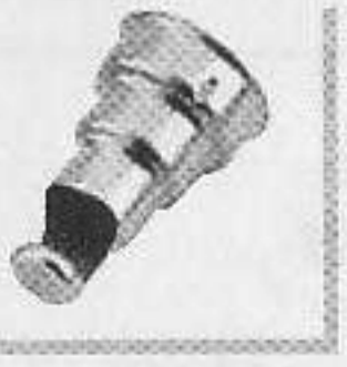
型號: 074616 名稱: 焊錫咀14毫米 功能: 焊錫及熱收縮