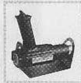
編號:075408 熱風槍固定架