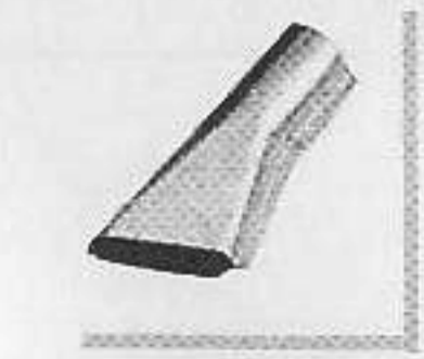
型號: 071011 名稱: 膠焊咀20毫米 功能: 焊接防水帆布 須與070618接駁使用