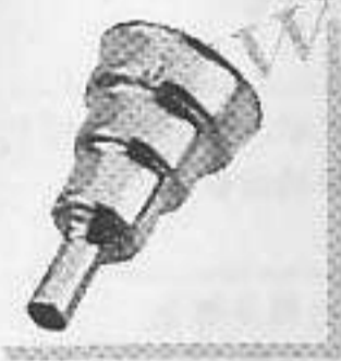
型號: 070618 名稱: 圓咀9毫米 功能: 集中最小風量