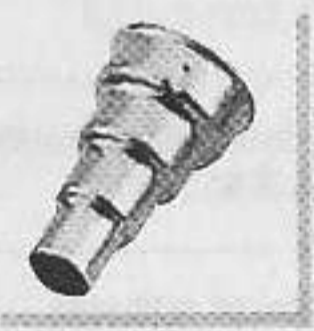
型號: 070717 名稱: 圓咀14毫米 功能: 集中一般風量