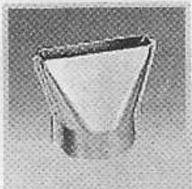
編號:070113 平咀(50毫米) 把熱風平均分佈在較細小的面積表面, 用來焊接防水帆布等...