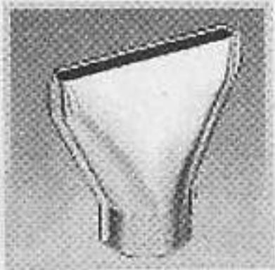
編號:070212 平咀(75毫米) 把熱風集中在較廣闊的面積表面, 用來烘乾,除漆等...